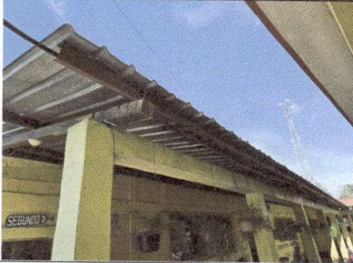
Foto7: Sustitución de canales de PVC y bajada de agua pluvial.