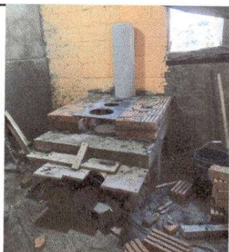
Foto 17: Sustitución de estufa rural (completa) incluye chimenea y plancha de metal. Instalación de azulejo en estufa rural.