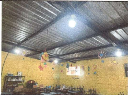
Foto13: Sustitución de focos ahorradores.