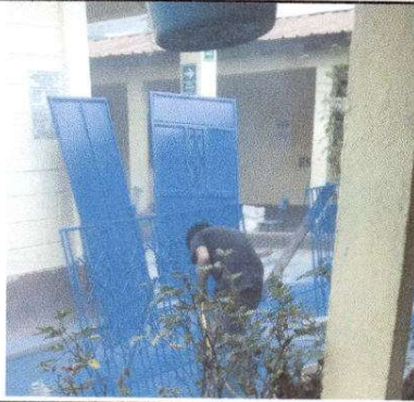
Foto1: Mantenimiento a estructura (lijado, cambio de tubo, cepillado, sujecioens, aplicacián de pintura).