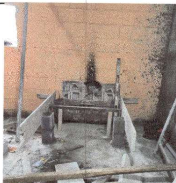
Foto 16: Sustitución de estufa rural (completa) incluye chimenea y plancha de metal. Instalación de azulejo en estufa rural.