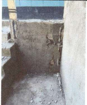
Foto 11: Reparación red de agua potable: sustitución de tubería línea principal. Sustitución de llave de globo.